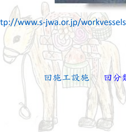
回施工設施 回分類索引