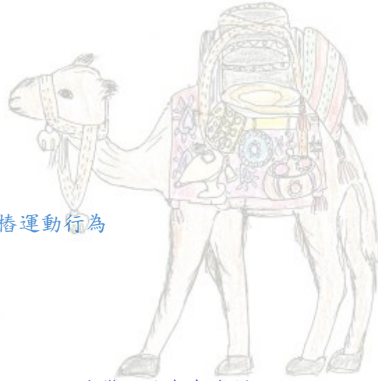
回港灣設計參考資料 載滿珠寶的駱駝