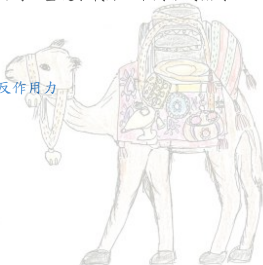
回港灣設計參考資料